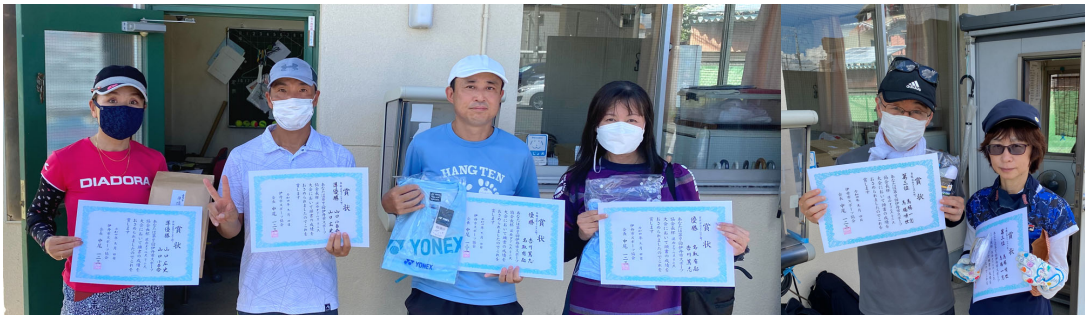
準優勝/山口・山口 (PEACE)