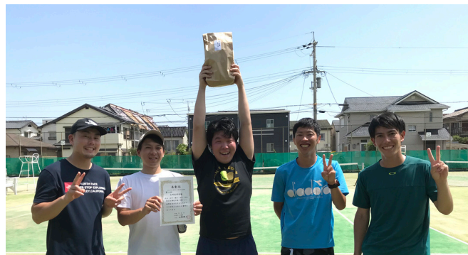
三位/永岡庭球道場