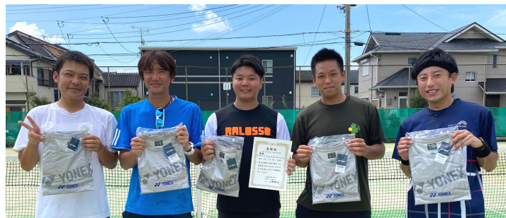
優勝/クアドリフォリオ ルージュ