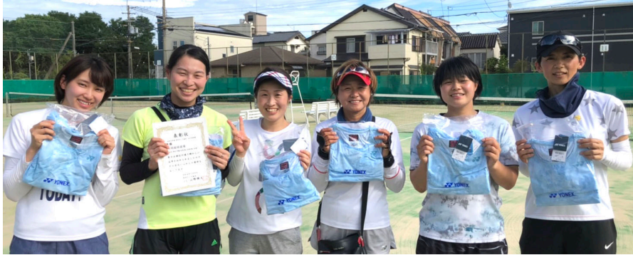
優勝/永岡庭球道場