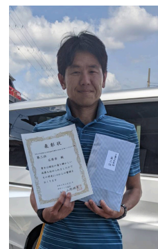
三位/堀江邦看(エトセトラ)